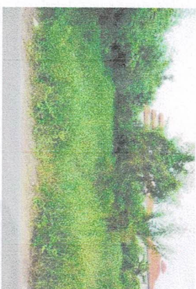
ที่รกร้างว่างเปล่า