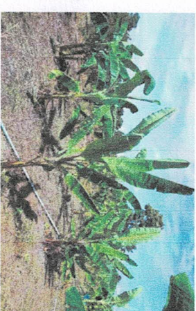
ที่ทำการเกษตร